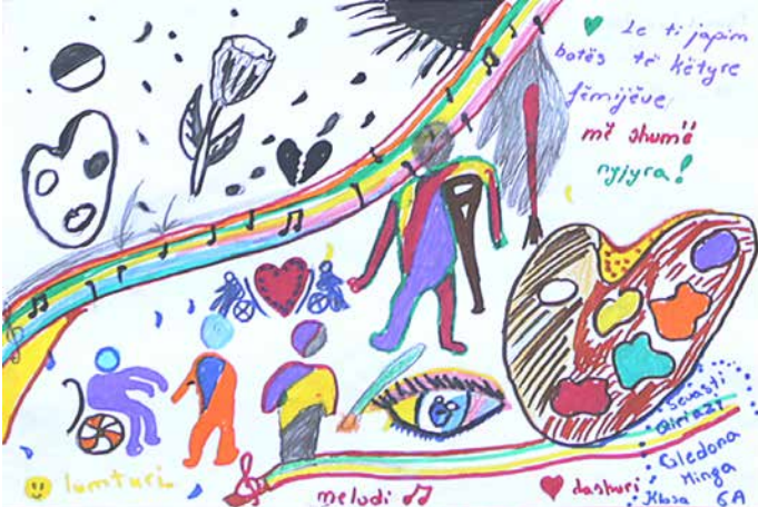
Vizatimet janë krijime të fëmijëve në kuadër të fushatës #VizatoAftësinëEkufizuar

Ligji për arsimin 1 garanton të drejtën për arsimim të të gjithë personave që jetojnë në Shqipëri, përfshirë të huajt dhe personat pa nënshtetësi, pa dallime në bazë të gjinisë, racës, etnisë, gjuhës, orientimit seksual, besimeve politike apo fetare, situatës ekonomike apo sociale, moshës, vendbanimit dhe aftësisë së kufizuar. Dispozita të tjera ligjore synojnë të vënë në funksionim masat për garantimin e barazisë në aksesin në arsimin parauniversitar 2 . Megjithatë, të dhënat vendore nuk arrijnë të na japin një panoramë të qartë të nivelit në të cilin këto të drejta realizohen në praktikë për